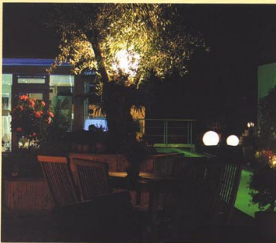
Moonlight im Olivenbaum – mediterranes Flair auf der Insel-Terrasse.