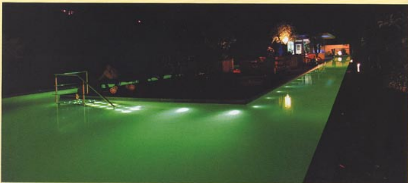
Der Naturpool hat eine Länge von 150 Metern.