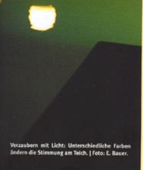
Verzaubern mit Licht: Unterschiedliche Farben ändern die Stimmung am Teich.