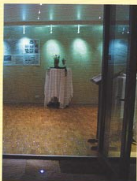
Auch dieser „Sternenhimmel“ im Eingangsbereich des Pavillons wurde mit Lichtleit-Fasertechnik erzeugt.